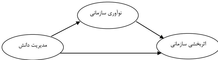
شکل ۱: مدل مفهومی تحقیق

ارتباط اثربخشی سازمانی با متغیرهای فردی، محیطی و سازمانی اثرگذار بر آن به ویژه دو متغیر مدیریت دانش و نوآوری سازمانی و ارائه یک الگوی عمومی در این حوزه، کاملاً احساس می‌شود. لذا با توجه به محدود بودن تحقیقات انجام شده در زمینه اثربخشی سازمانی به طور کلی و محدود بودن این تحقیقات بویژه در حوزه ورزش و نیز برخی نتایج متناقض در تحقیقات انجام شده و نیز عدم ارائه یک الگوی ارتباطی در زمینه متغیرهای فردی، سازمانی و محیطی اثرگذار بر اثربخشی سازمانی، هدف اصلی این تحقیق، مدل‌سازی معادلات ساختاری مدیریت دانش، نوآوری و اثربخشی سازمانی کارکنان وزارت ورزش و جوانان ایران است. با توجه به مبانی نظری و پیشینه تحقیقات انجام شده، محقق مدل زیر را به عنوان مدل زیربنایی و مفهومی تحقیق جهت مدل‌سازی این ارتباطات در کارکنان وزارت ورزش و جوانان ایران مورد استفاده قرار داد.