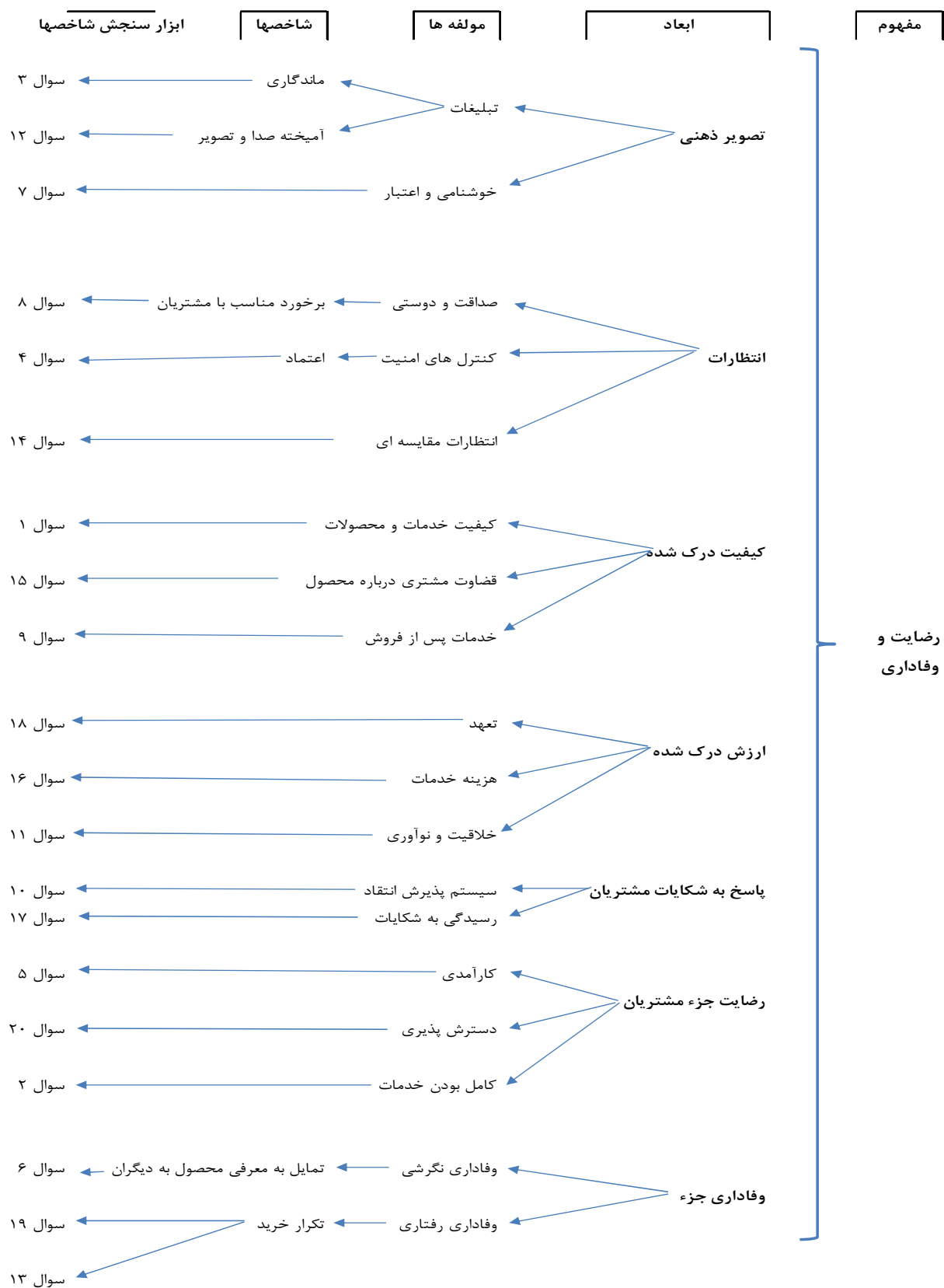
شکل ۲: مدل کامل شده متغیرهای تاثیرگذار بر رضایت مشتری بر اساس شاخص های ECSI (بعد، مولفه، شاخص و ابزار)