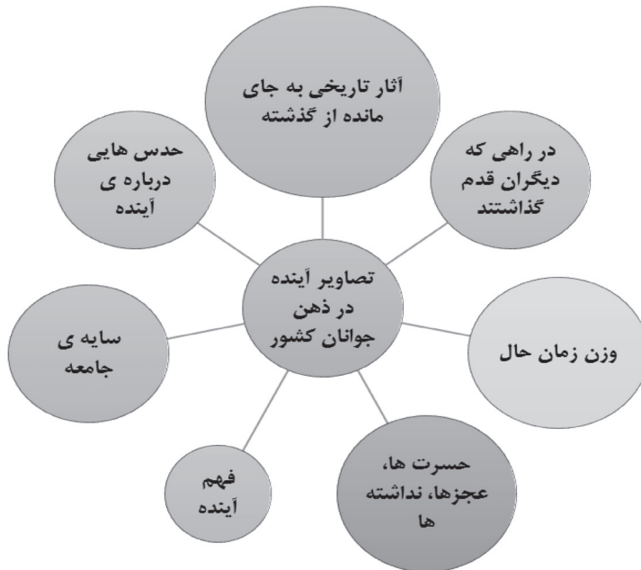
شکل ۱: تم‌های اصلی سازنده تصاویر جوانان از آینده

نتایج نهایی حاصل از تحلیل مضمون در شکل ۱ آمده است.