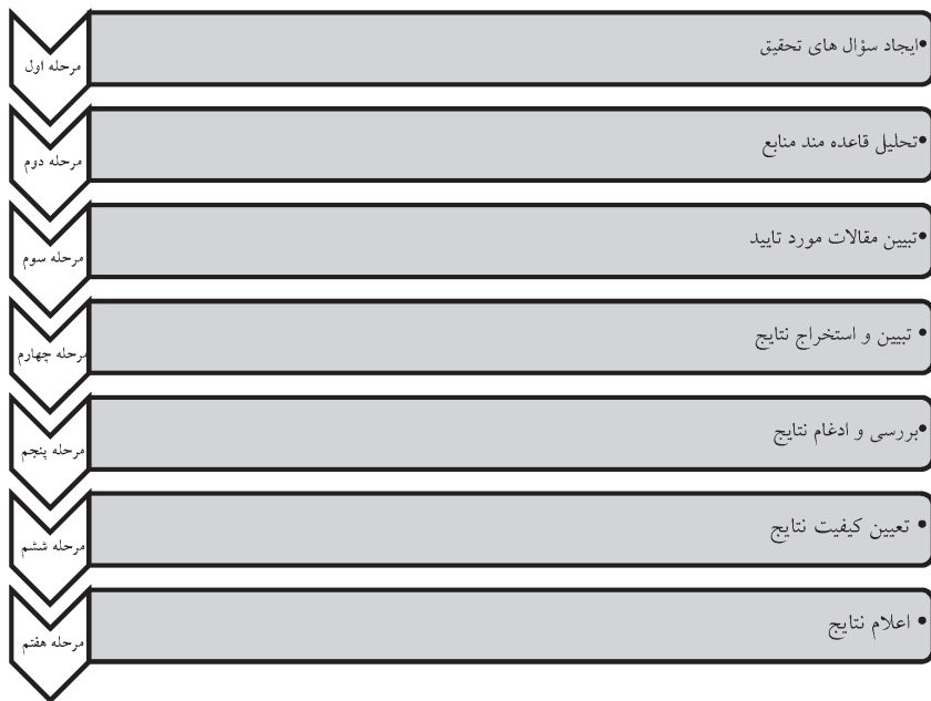
شکل ۱: مراحل پیاده سازی روش فراترکیب

بر اساس شکل ۱، مراحل مبسوط پیاده سازی روش فراترکیب به شرح زیر می باشد: