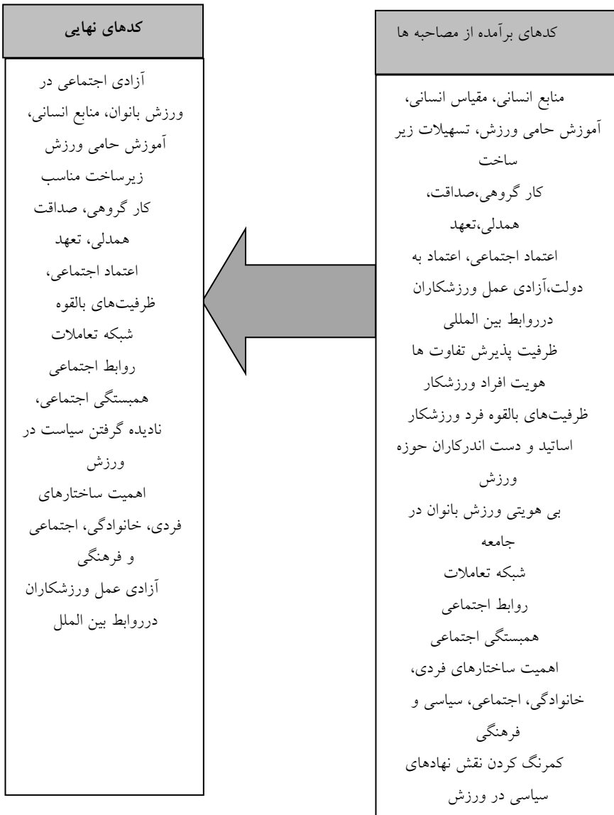
نمودار ۱. پالایش کدهای برآمده از مصاحبه با متخصصان و استخراج کدهای نهایی

پس از انجام مرحله اول و تحلیل محتوای مصاحبه ها، شاخص های موثر بر سرمایه اجتماعی در حوزه جامعه شناسی ورزش یا در اصطلاح «کدهای مکانی» از نگاه این ده متخصص استخراج شد. در نهایت ۲۱ کد، به عنوان کدهای مکانی موثر بر سرمایه اجتماعی در تعامل با بستر اجتماعی تعیین گردید. این فرایند در نمودار ۱ دیده می شود.