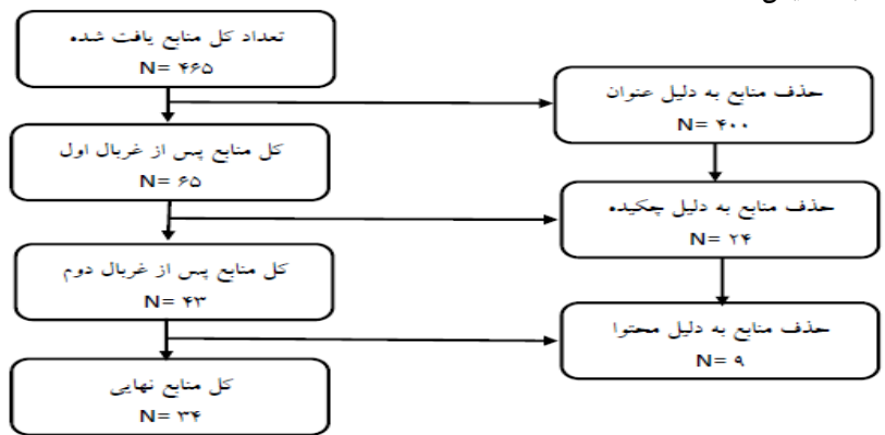
شکل ۲. نتایج جستجو و چگونگی انتخاب منابع مناسب

جستجو و انتخاب منابع مناسب: در این مرحله، منابع و مقالات یافت شده چندین بار بررسی و بازبینی گردیدند و در هر بررسی چندین مقاله رد شد. ابزاری که برای ارزیابی کیفیت پژوهش‌ها در این مرحله استفاده شد، روش ارزیابی حیاتی کسپ ۱ بود که شکل ۲ مراحل اجرای این روش و منابع منتخب را به نمایش گذاشته است: