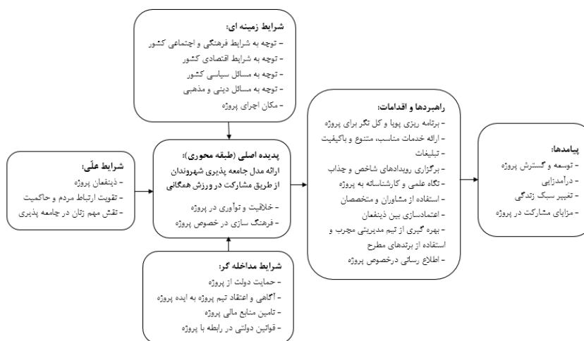
شکل ۲: مدل پارادایمی جامعه‌پذیری شهروندان از طریق مشارکت در ورزش همگانی

در مراحل بعد یعنی مرحله کدگذاری محوری و کدگذاری انتخابی (گزینشی) بین مقولات ایجاد شده، رابطه شکل گرفت. اساس فرآیند ارتباط دهی در کدگذاری محوری، بر تمرکز و تعیین یک مقوله به عنوان مقوله محوری یا اصلی قرار داشت که این مقوله محوری همان هدف اصلی تحقیق می باشد. سپس سایر مقولات به عنوان مقولات فرعی به مقوله اصلی ارتباط داده شدند. پس از تعریف مقوله محوری، شرایط علی، شرایط زمینه‌ای، شرایط مداخله‌گر، راهبردها و اقدامات و پیامدهای ناشی از آنها تعریف شد. به این ترتیب با ایجاد یک آهنگ و چیدمان خاص بین مقوله‌ها، مدل شکل ۲ برای جامعه‌پذیری شهروندان از طریق مشارکت در ورزش همگانی تنظیم گردید: