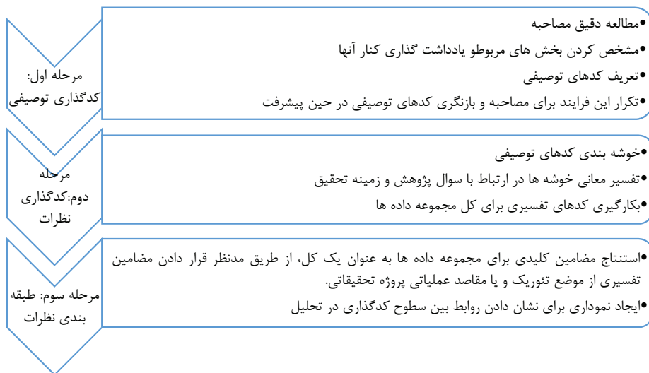
شکل ۱: فرآیند تحلیل (کینگ و هاروکز، ۲۰۱۰)

۱. کدگذاری توصیفی؛ ۲. کدگذاری نظرات؛ ۳. طبقه‌بندی نظرات در گروه‌های مفهومی یکسان. این رویکرد دارای رویه‌های مختلفی می‌باشد که در این تحقیق از رویه کینگ و هاروکز ۱ که در سال ۲۰۱۰ بر اساس جمع بندی رویه های مختلف ارائه شد، استفاده گردیده است. این رویه دارای سه مرحله کدگذاری توصیفی، کدگذاری تفسیری و یکپارچه‌سازی از طریق مضامین فراگیر است و فرآیند آن در شکل ۱ نشان داده شده است: